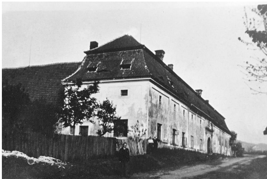
Horní dvůr v r. 1955 před požárem kdy přišel o mansardovou střechu